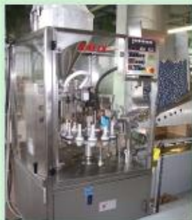
Тубонаполнительные машины французской фирмы «KALIX» для фасовки в пластиковую и ламинатную тубу