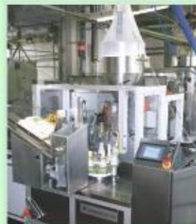
Тубонаполнительная машина шведской фирмы «Norden» Nordentmatic 402-DAS