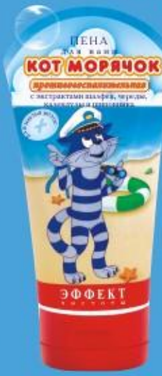
Пена для ванны «Кот Морячок» (150г)

Мягкая пушистая пена хорошо и нежно очищает кожу и волосы ребенка во время купания. Комплекс экстрактов шалфея, череды, календулы и шиповника обладает прекрасным противовоспалительным действием, что так необходимо для чувствительной кожи. Ароматная пена превратит купание в праздник.