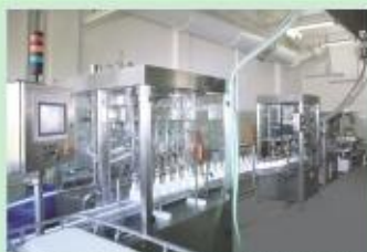
Автоматическая линия французской фирмы «РКВ» по фасовке косметических средств во флаконы