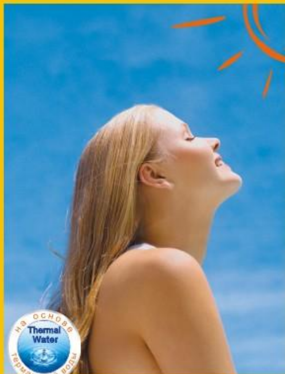
В течение всего пребывания на солнце используйте солнцезащитные средства серии «Лаборатория-Эффект».