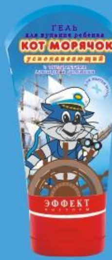
Гель для купания ребенка «Кот Морячок» (150г)

Экстракт лаванды, обладающий прекрасным седативным действием, регулирует эмоциональный фон, успокаивает и расслабит малыша, особенно перед сном. Экстракт ромашки снимает раздражение и покраснение, уменьшает шелушение. Не содержит мыла и красителей.