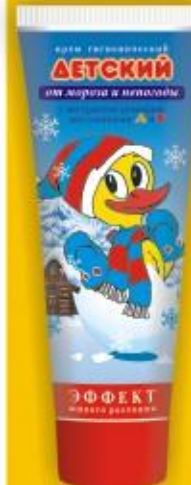
Крем детский гигиенический «Детский» от мороза и непогоды (70 г)

Экстракт лаванды, обладающий прекрасным седативным действием, регулирует эмоциональный фон, успокаивает и расслабит малыша, особенно перед сном. Экстракт ромашки снимает раздражение и покраснение, уменьшает шелушение. Не содержит мыла и красителей.