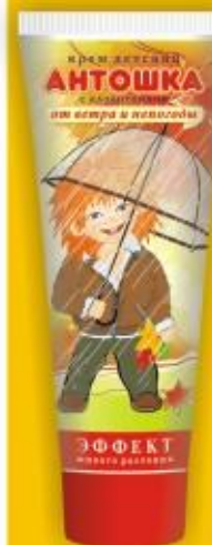
Крем детский «Антошка» с аллантоином от ветра и непогоды (70 г)

Крем, созданный по уникальной формуле обратной эмульсии «вода в масле», содержит 70% натуральных масляных компонентов. Ланолин защитит кожу Вашего малыша от агрессивных воздействий окружающей среды (мороза, ветра, влажности) во время прогулок в холодное время года. Экстракты череды и ромашки обладают противовоспалительным, антисептическим и заживляющим действиями. Витамины А и Е обеспечат мягкость и эластичность кожи малыша.