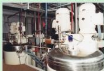
Процессорная установка «FRYMA» для приготовления косметических масс

Все оборудование, соприкасающееся с продуктом или его составляющими, сделано из полированной нержавеющей стали АИСИ-316, сертифицированной по нормативам косметического производства и полностью отвечающей Европейским требованиям.