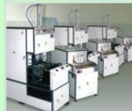
Линия по производству ПЭТ-тары