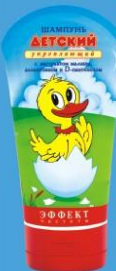
Шампунь «Детский» с экстрактом малины (150г)

Мягкие моющие компоненты шампуня деликатно очищают волосы, сохраняя естественный водно-жировой баланс кожи головы. D-пантенол оказывает на волосы длительное увлажняющее действие и придает им блеск. Комплекс алантоина и экстракта малины прекрасно успокаивает чувствительную кожу головы. Шампунь придает волосам естественную пышность и мягкость.