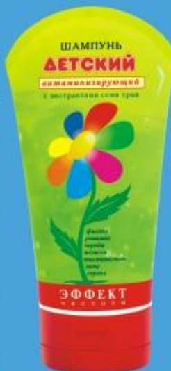
Шампунь «Детский» с экстрактами семи трав (150г)

Мягкие моющие компоненты шампуня прекрасно очищают волосы, сохраняя естественный водно-жировой баланс кожи головы. Комплекс экстрактов семи трав - это настоящий растительный коктейль, обогащенный витаминами и минералами, которые питают кожу головы и укрепляют корни волос. Волосы после применения шампуня ухожены и легко расчесываются, что особенно важно для длинных волос.