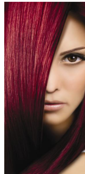
66 Рубиновая мечта