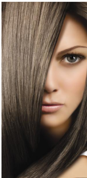
70 Темный пепельно-русый

Палитра COLOR TIME состоит из 15 стильных и натуральных оттенков