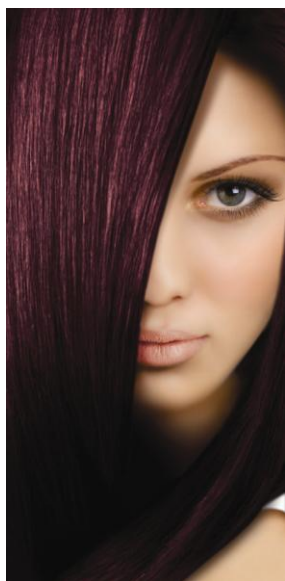
50 Темный махагон