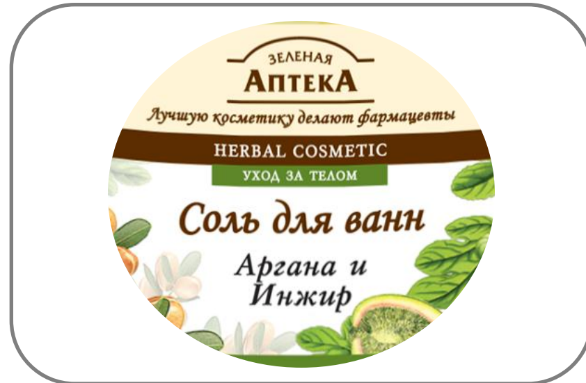
СОЛИ ДЛЯ ВАНН