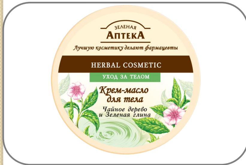
КРЕМ-МАСЛО ДЛЯ ТЕЛА (BODY BUTTER)